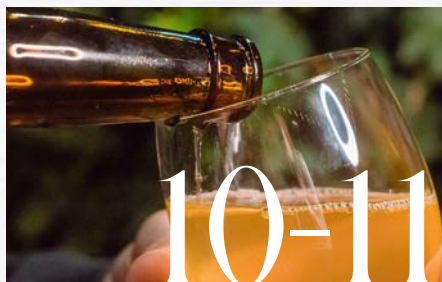
NOS BIÈRES ET APÉRITIFS SANS ALCOOL