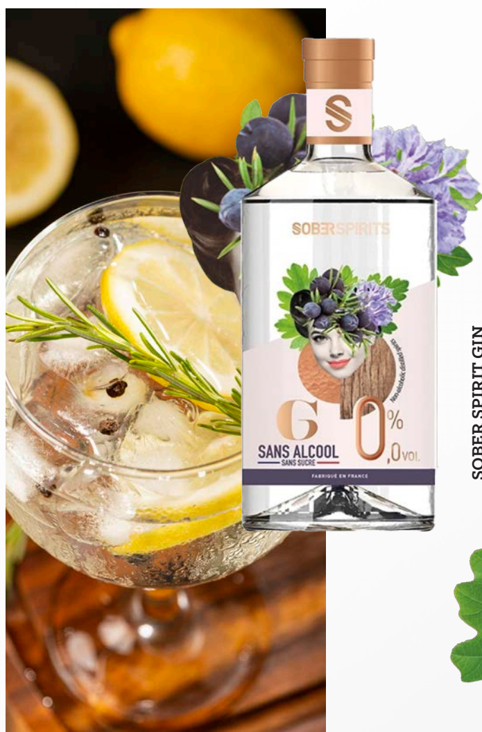
SOBER SPIRIT GIN 50 cl - 0° - 24.02.02 18.25 € HT HD/col