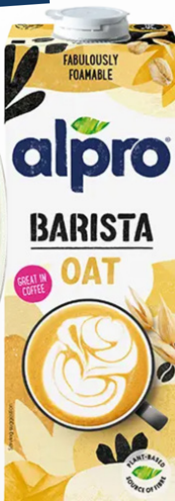
ALPRO BARISTA AVOINE 100 cl - Pack de 8 241157