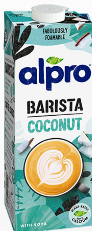
ALPRO BARISTA NOIX DE COCO 100 cl - Pack de 8 241159