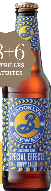
BROOKLYN SPECIAL EFFECT 0,4° 24 x 33 cl - 240163