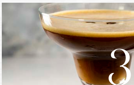
LE COCKTAIL DU MOIS : LE VIRGIN AMARETTI ESPRESSO