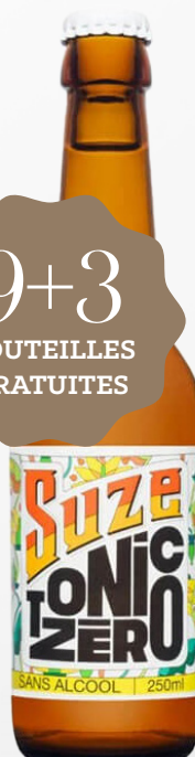
SUZE TONIC 0% 24 x 25 cl VP - 251733