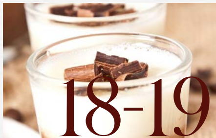
NOUVEAUTÉ : LA GAMME ALPRO BARISTA