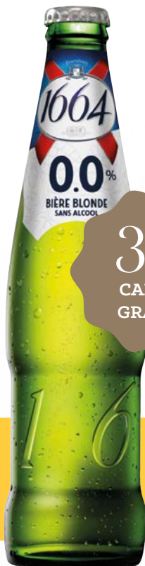
1664 SANS ALCOOL 0° 12 x 33 cl - 220344