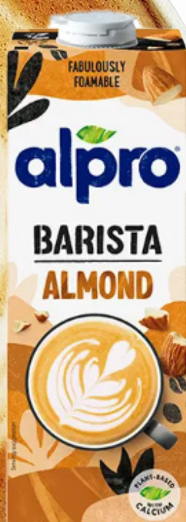
ALPRO BARISTA AMANDE 100 cl - Pack de 8 241156