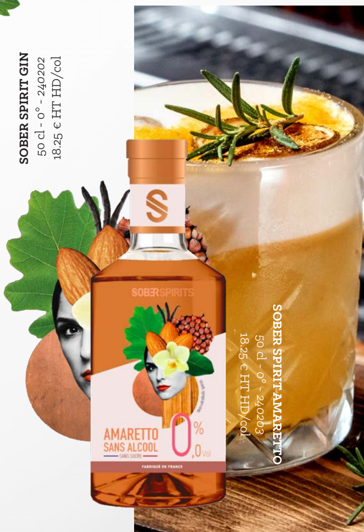
SOBER SPIRIT AMARETTO 50 cl - 0° - 24.02.03 18.25 € HT HD/col