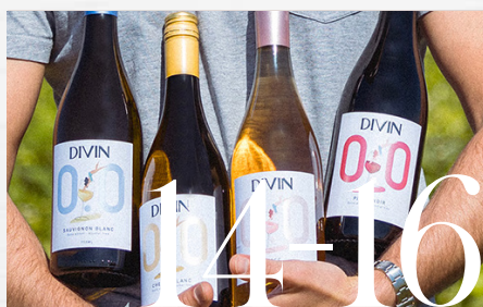
NOUVEAUTÉ : NOS VINS SANS ALCOOL