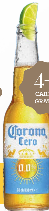
CORONA CERO 0° 24 x 33 cl VP 230332