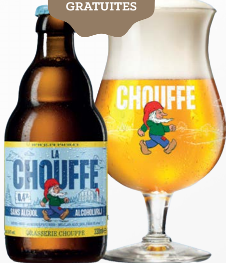
CHOUFFE SANS ALCOOL 0,4° 24 x 33 cl - 230179