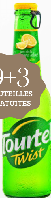
TOURTEL TWIST CITRON 0° 12 x 27,5 cl VP - 220495