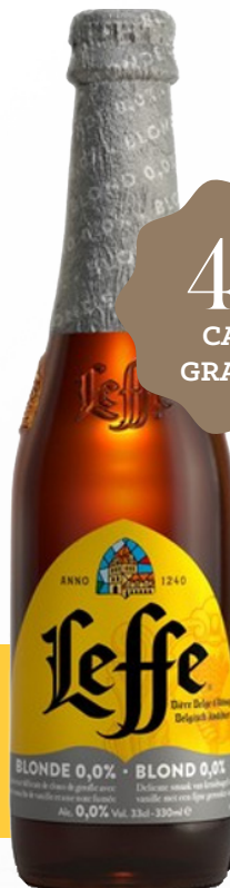
LEFFE BLONDE 0° 24 x 33 cl VC 191201