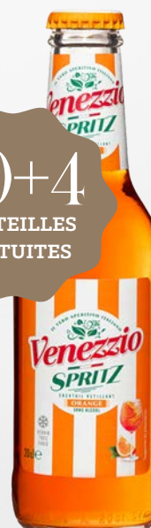
VENEZZIO SPRITZ 0° 24 x 20 cl - 220100