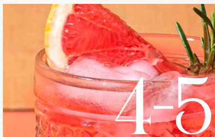
LE DRY JANUARY & LA TENDANCE DES SPIRITUEUX SANS ALCOOL