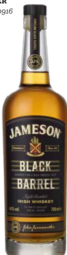
WHISKEY JAMESON BLACK BARREL 70 cl - 40° - 161210