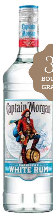
CAPTAIN MORGAN White