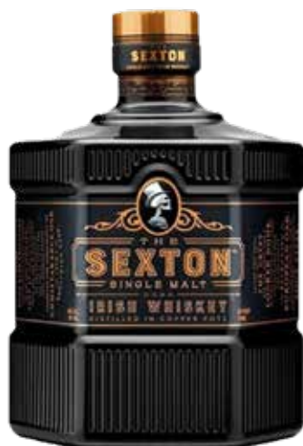
WHISKEY SEXTON 70 cl - 40° - 240295