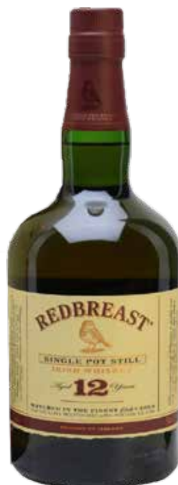
WHISKEY REDBREAST 12 ANS 70 cl - 40° - 240914