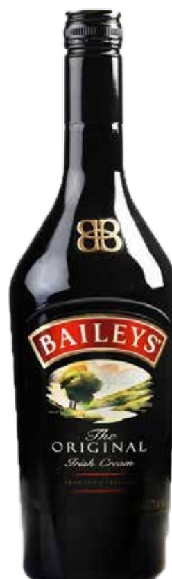
BAILEY'S IRISH CREAM 70 cl - 17° - 241062