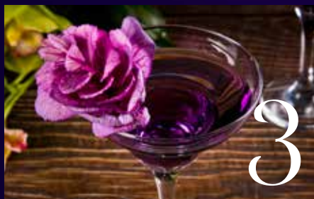
LE COCKTAIL DU MOIS : LE BAISER DE CUPIDON