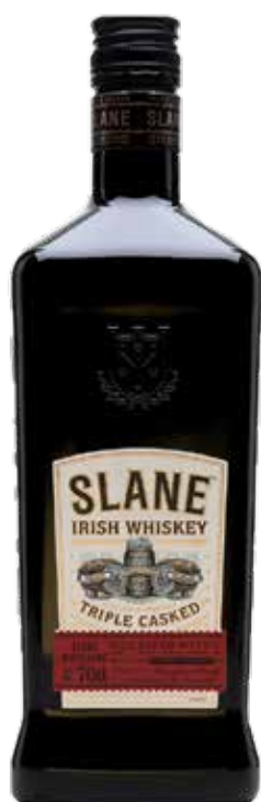
WHISKEY SLANE 70 cl - 40° - 190344