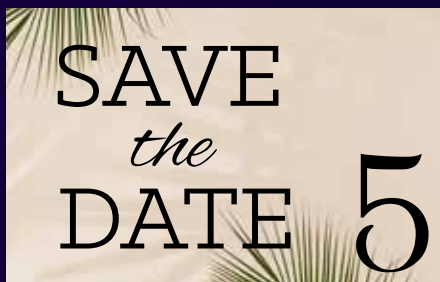
NOS JOURNÉES PORTES OUVERTES