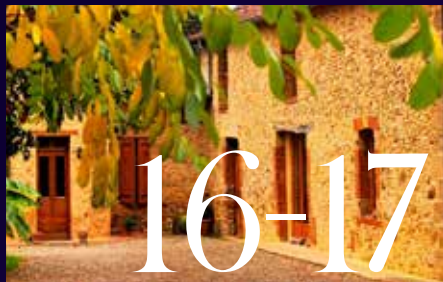
DOMAINE DU MOIS : DOMAINE DE JOY