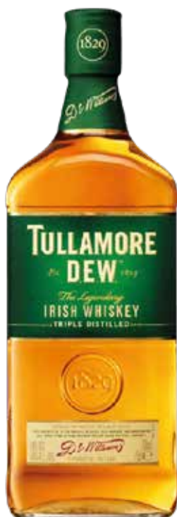
WHISKEY TULLAMORE DEW 70 cl - 40° - 1123