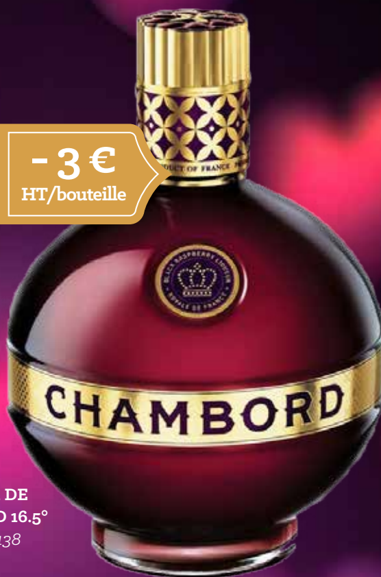
LIQUEUR DE CHAMBORD 16.5° 70 cl - 22138