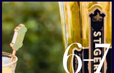
NOS ALCOOLS PREMIUM