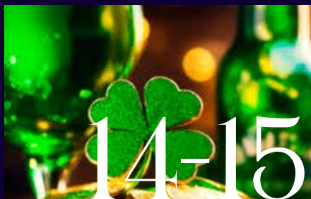
SÉLECTION SAINT PATRICK 100% IRISH SPIRIT