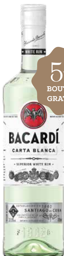
BACARDI Carta Blanca