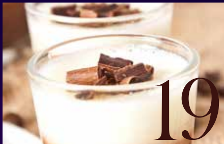
NOUVEAUTÉ : LA GAMME ALPRO BARISTA