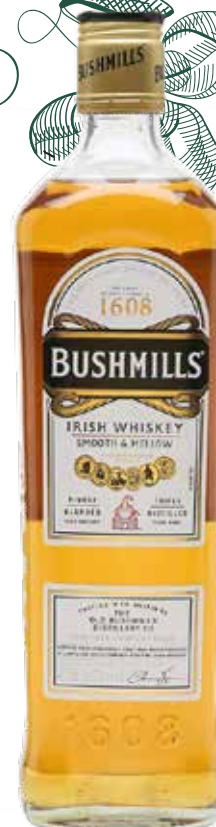
WHISKEY BUSHMILLS ORIGINAL 70 cl - 40° - 240296