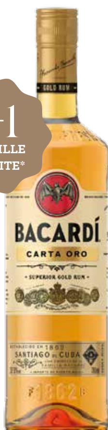
BACARDI Carta Oro