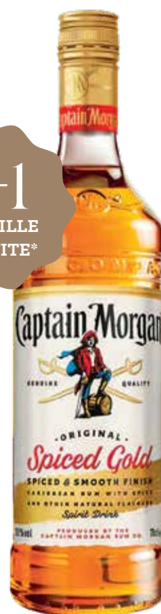
CAPTAIN MORGAN Spiced Gold