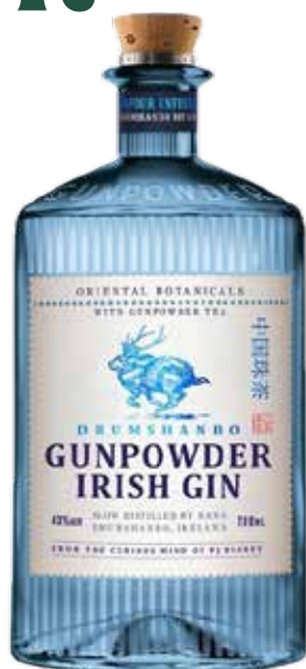
GIN DRUMSHANDO GUNPOWDER 70 cl - 43° - 240916