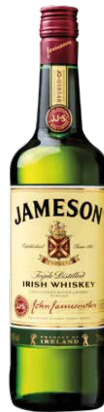
WHISKEY JAMESON 70 cl - 40° - 1125